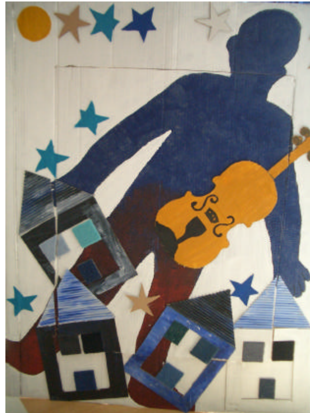
Le violoniste bleu (d'après Chagall)...