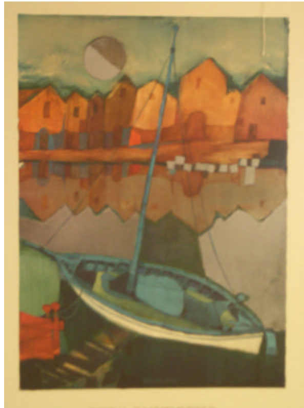
Le Petit Port de Rosina Weichmeister