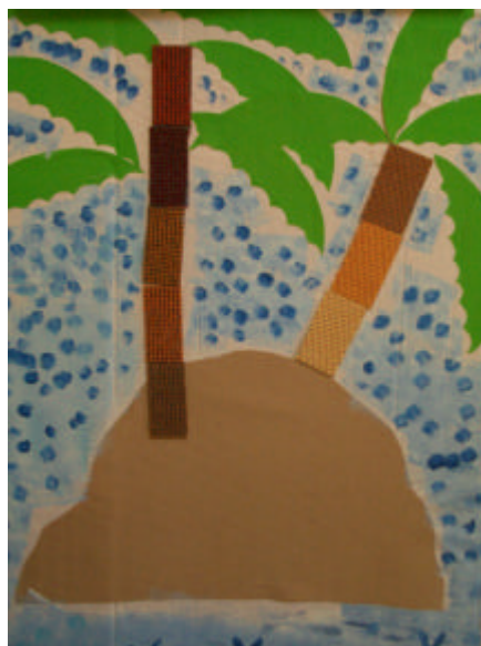
... il arrive sur une île