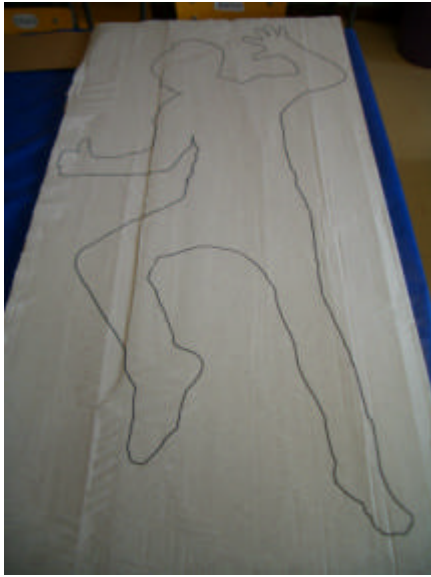
Silhouettes (Fernand Léger)

Quelques photos sur la réalisation du grand livre animé qui a servi de fil conducteur au spectacle de fin d'année (format : 1m20 sur 90)