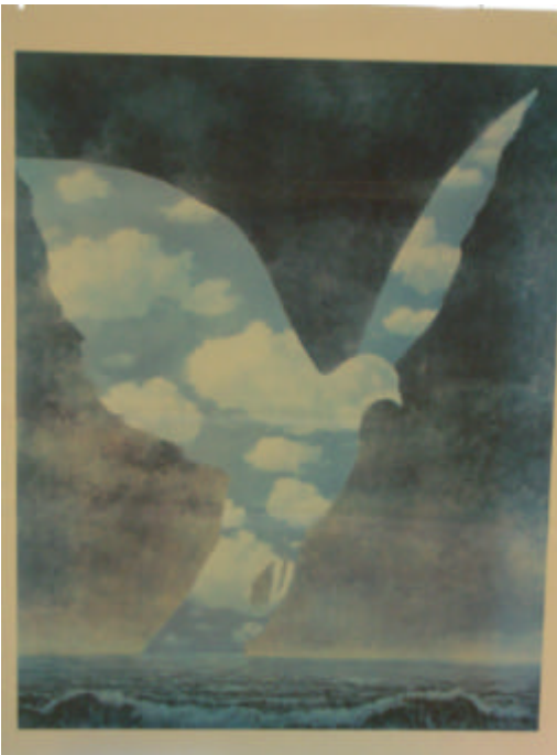
Les Plongeurs noirs de René Magritte