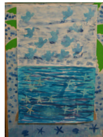
...il traverse la mer