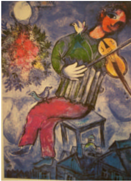
Le Violoniste bleu de Marc Chagall