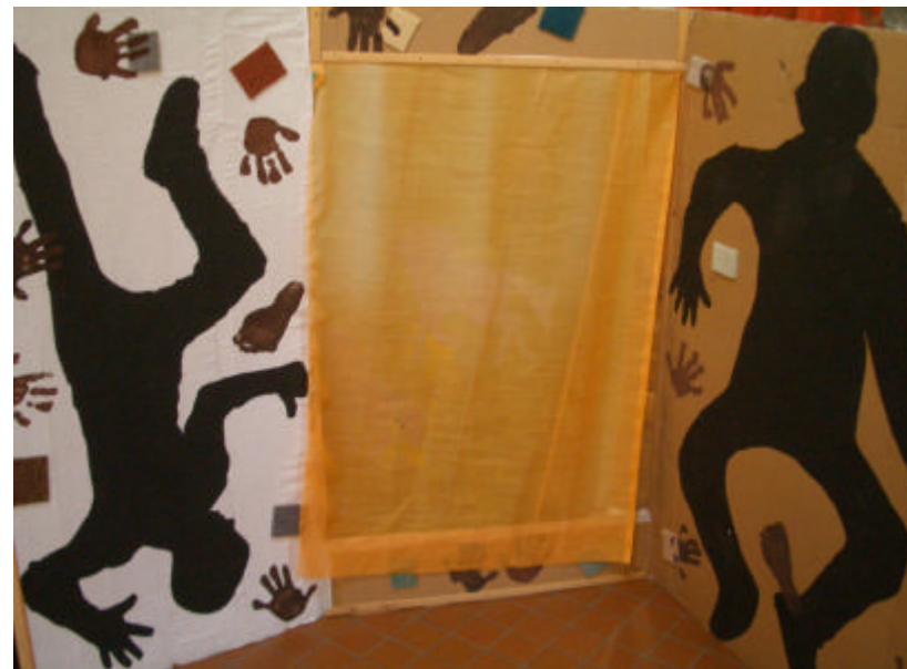
... il arrive au pays des ombres (silhouettes d'après Fernand Léger)