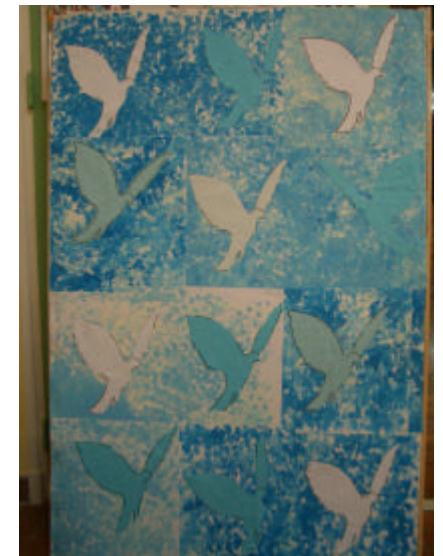
... il rencontre des oiseaux (d'après Magritte)