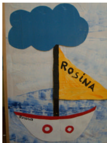
... il monte sur un bateau (d'après Rosina Wachtmeister)